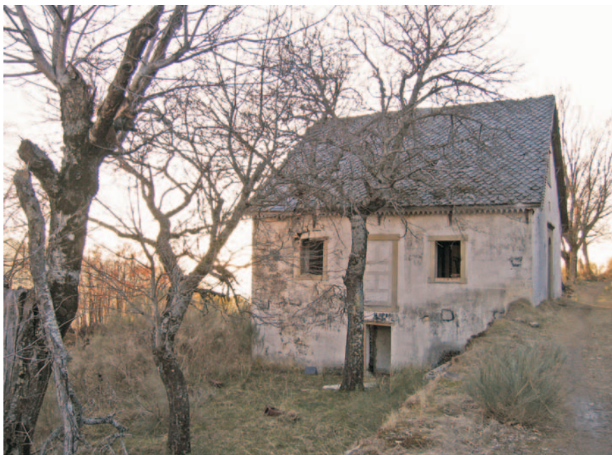
Casa principal ou do propietario das minas.