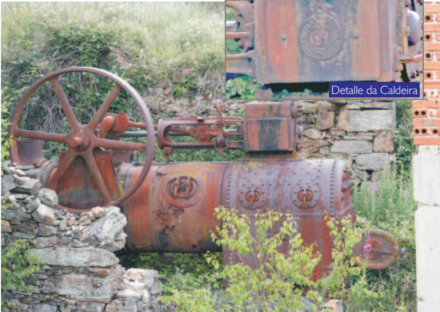
Detalle da Caldeira