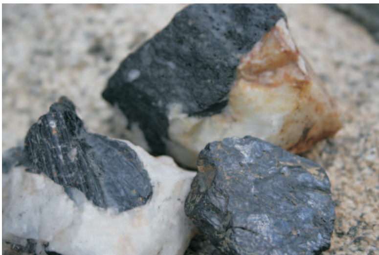
Pedras de mineral de wólfram

Nas minas de Vilanova de Trevinca a extracción deste mineral foi dunha tonelada o mes no ano 1.945 (uns vinte sacos de cincuenta quilos cada un). O mineral era tan denso e de tanta calidade (con leis de 7000/8000 g/t), que unha pedra do tamaño dunha pelota de golf pesaba máis de medio quilo. Nó núcleo mineiro de Casaio minas de Valborraz, a produción media era de 10/12 toneladas o mes.