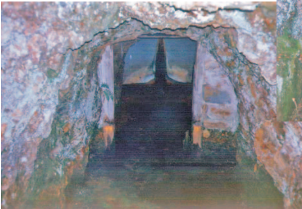
Boca de entrada da mina "Pepe"