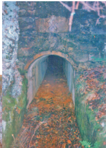
Boca de entrada da mina "José Antonio"